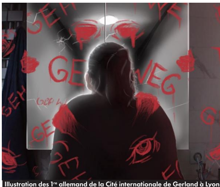
Illustration des 1 er allemand de la Cité internationale de Gerland à Lyon.

Les Friedland de Daniel Kehlmann, une œuvre captivante regroupant philosophie, humour et ironie ! Un père et ses trois fils se rendent un après-midi des années 1980 à un spectacle d'hypnose. Ce qui devait être un simple divertissement déterminera leur vie. Trente ans plus tard, les conséquences se font sentir dans la famille Friedland... Arthur, le père a disparu pour vivre de ses écrits, il réapparaît furtivement comme par magie. Comme lui, ses fils pratiquent tous le mensonge à leur manière, cela ne leur apporte aucun bonheur : Martin, le fils aîné, obèse et passionné par le Rubick'sCub, est devenu un prêtre athée ; Eric, infidèle, accro aux psychotropes, est un conseiller financier arnaquant ses clients, la crise de 2008 le sauvera de la prison. Iwan, le jumeau d'Eric, peintre faussaire subit une mort hasardeuse. Les chapitres naviguent entre narrateur omniscient et narrateurs-personnages révélant l'imposture des différentes identités. Tous plus loufoques les uns que les autres, leurs aventures sont souvent grotesques, parfois tragiques. L'hilarité s'accroît quand l'auteur donne au lecteur le point de vue de chaque frère lors de situations identiques, dépliant en une journée unique toutes